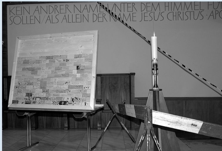
Holzbrettchen mit Gedanken der Gemeindemitglieder.

Das Vorbereitungsteam stellte ein abwechslungsreiches Programm unter dem Motto «Unter-