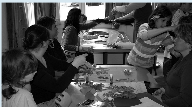
Viel Spass beim gemeinsamen Basteln.